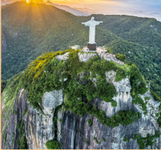
Le Christe rédempteur (Rio de Janeiro)